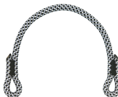
PONT D'ATTACHE MILLO AUXILIAIRE